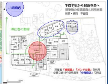
建築物の増改築と周辺施設との機能分担分析