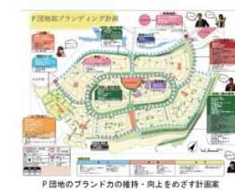
P団地のブランド力の維持・向上をめざす計画案