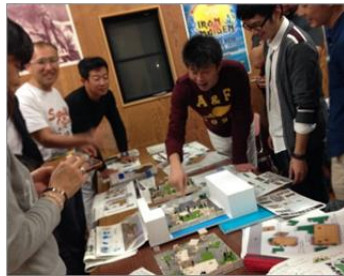
模型を利用した空き地の活用案を検討するワークショップ

●受託研究事業: 地方都市における民間投資を促進する新しい都市再生事業のモデル提案(財)民間都市再生機構/街路・公園・空き地・空き家の利活用に関する調査再生事業(大分市、杵築市協議会、津久見市協議会、豊後大野市)