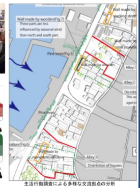
生活行動調査による多様な交流拠点の分析