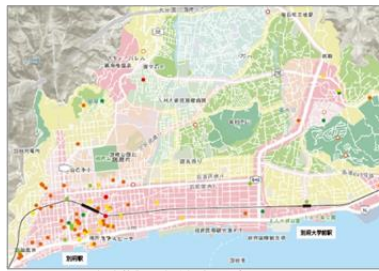
観光施設の立地傾向の分析 (GIS)

●受託研究事業: 文化的景観に関する学術調査(別府市、豊後大野市、姫島村)/条例や計画の改定・策定に資する調査研究(大分県、別府市、大分市)