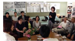
地域住民や学生の意見交換・提案発表会

●受託研究事業: 規模・基盤・産業・行政施策の経年変化にみる離島の構造特性と類型化—地方における自立的地域運営・経営に関する研究—(国土交通省・国土計画協会)/離島や小集落における持続可能な生活環境に関する調査・提案事業(大分県、津久見市、玖珠町商工会、P団地管理組合)