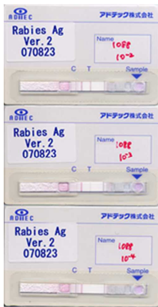
Diagram of rapid immunodiagnostic kit for the detection of rabies virus