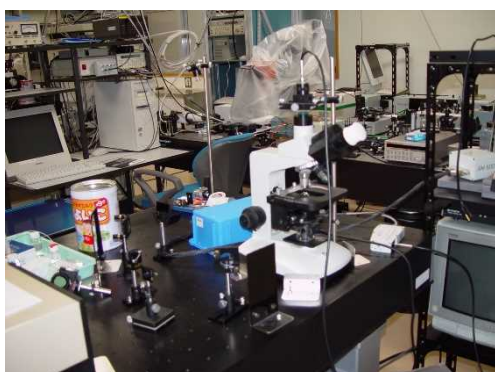
レーザー+顕微鏡+光学計測機器

レーザー多光子イオン化法を用いた油/水界面の分析, 顕微鏡とレーザーを組み合わせた発光法による水溶液中の金属の高感度分析, 色変化による匂い分析のための簡易型センサの開発, 抗原抗体反応の高感度分析などを行っています。