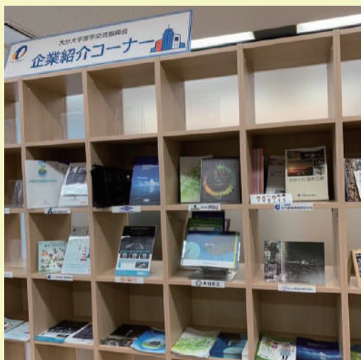
学術情報拠点(図書館)企業紹介コーナー